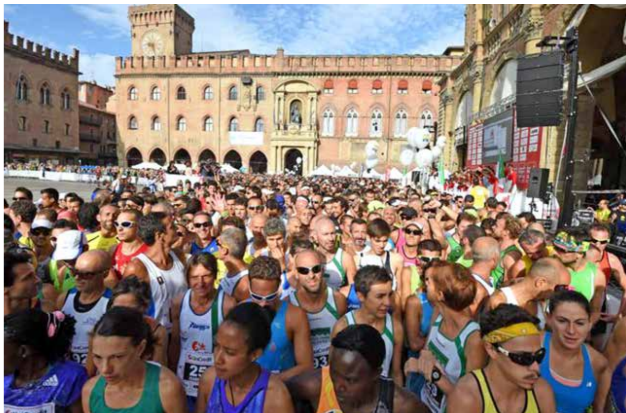
Numeri da primato per la quindicesima edizione della Run Tune Up di Bologna

Domenica la 15esima edizione della Mezza Maratona: le novità e tutti gli appuntamenti