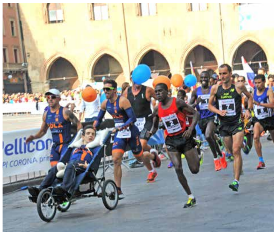
Un pieno di eventi all'interno del programma della Run Tune Up

la rete pubblica, senza l'impiego di plastica e con particolare attenzione verso la raccolta differenziata dei rifiuti. E saranno molti anche i runner che arriveranno da tutto il mondo e che hanno voluto idealmente condividere questo percorso di salute e solidarietà. Sarà quindi una festa davvero ecumenica. Ci saranno tanti motivi, quindi, per correre la classica mezza maratona di Bologna. E per sentirsi parte integrante di un grande progetto