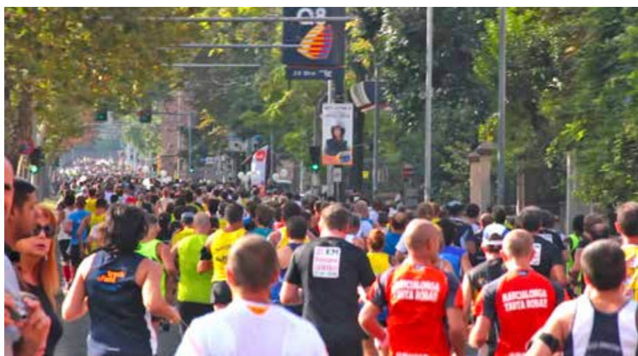
Attenzione all'ambiente e solidarietà: due capisaldi dell'evento bolognese

GARA NELLA GARA. Gli organizzatori stavolta hanno davvero voluto stupire: oltre alle classifiche della prova competitiva, UniSalute Run Tune Up metterà in palio tre importanti riconoscimenti: il Trofeo UniSalute, dedicato ai dipendenti del Gruppo Unipol, il Trofeo Avis, dedicato ai donatori di sangue, e il Trofeo ConCORRIAMO per la Legalità, dove i protagonisti saranno i militari della Guardia di Finanza, i dottori commercialisti, gli avvocati e i dipendenti dell'Agenzia delle Entrate. Ma ci sarà divertimento per tutti, perché gli eventi non finiscono di certo qui: duran-