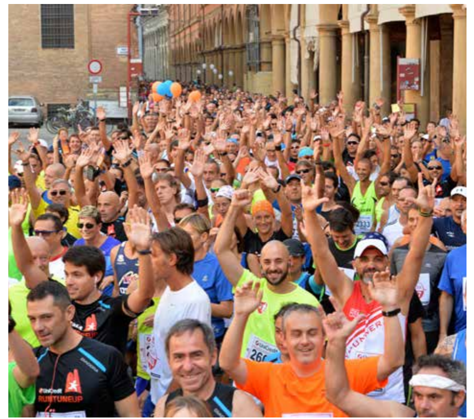
Musica e running: gli ingredienti della Run Tune Up

to si preannuncia davvero esplosivo: l'11 settembre ci saranno tanta energia ed entusiasmo allo stato puro per caricare a mille i partecipanti, per una corsa all'insegna dello sport, del movimento ma anche della musica al servizio della solidarietà. Davvero un'originalis-