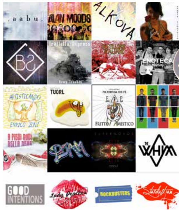
Le band che si esibiranno per Suona Bologna

Incredibile, ma vero: la Run Tune Up sarà anche la mezza maratona più suonata al mondo. Il perché è presto detto: i 4.280 partecipanti saranno accolti lungo la strada da 20 band, in pratica collocate a ogni chilometro. È questo il progetto "Suona Bologna", che si svilupperà sensibilizzando podisti e pubblico alla solidarietà e all'attività di Ageop, associazione impegnata nella lotta ai tumori in età pediatrica. Ageop ha partecipato alla realizzazione del 4° e 5° piano di Oncologia Pediatrica del Policlinico S. Orsola-Malpighi di Bologna, creando un reparto all'avanguardia e a misura di bambino. Un apporto consistente al lodevole progetto verrà inoltre offerto grazie alla Beat-Bit Music School. Il risulta-